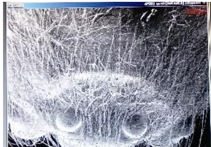
Le microscope électronique fait découvrir d'étranges choses.....